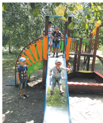
На фото: вихованці катеринівського дитсадка на майданчику, спорудженому АТ «Кіровоградське рудоуправління».