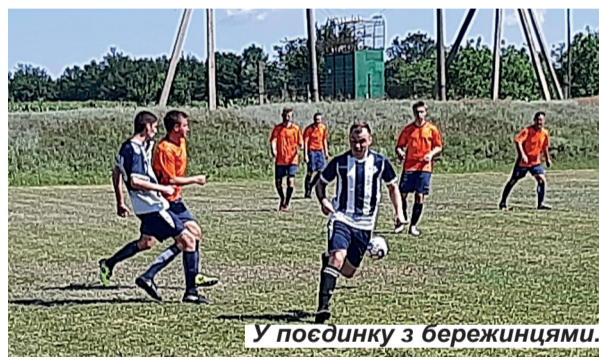
У посідинку з бережинцями.