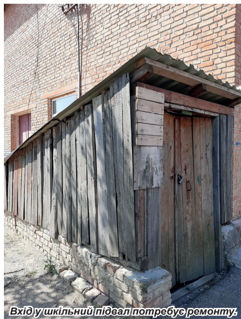
Вхід у шкільний підвал потребує ремонту.

– Так мені кажуть і в сільській раді, – від-