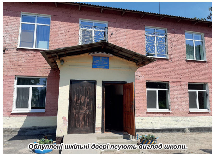
Облуплені шкільні двері псують вигляд школи.

Аби не бути голосливим, мій колега перелічив усі поліпшення в селі, названі йому Кучером: Грузьке обзавелося власними гербом і прапором, зовнішні стіни будинку культури пофарбовано в прийнятний жовтий колір, для самодіяльних артистів придбано костюми й музичну апаратуру («Без культури – ніяк», – наголосив Кучер), відремонтовано приміщення амбулаторії.