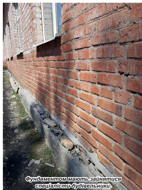
Фундаментом мають зайнятися спеціалісти-будівельники.

повіла та. – А я питаю: а на чиєму балансі наші діти? Вважаю, сільська рада може виділяти більше коштів на підтримку школи. Цьогорічний сільський бюджет становить понад шість мільйонів гривень, триста тисяч з нього на потреби школи можна було б виділити. Кажуть, багато хоч. А я не для себе – для школи, для дітей.