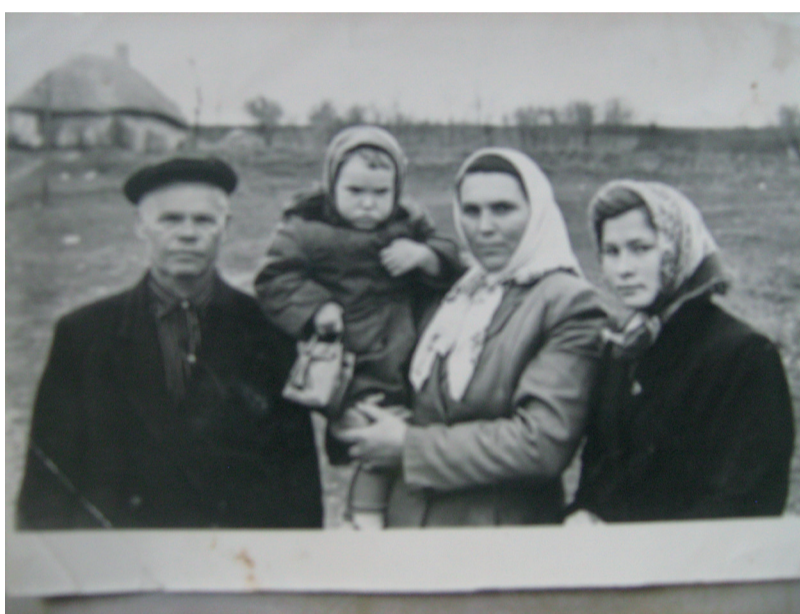
Жителі Осикуватого. 1 травня 1959 року