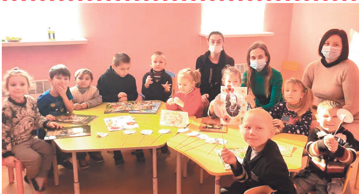
З нагоди Дня рідної мови у закладі дошкільної освіти «Малютко» (Володимирівка) відбувся захід «Рідна мова моя, поетична». Маленькі учасники ознайомилися з творами українських письменників, повпраляли й у рукоділлі.

Найкраще вживати мікрозелень сирого. Так вона найкорисніша. Її додають в салати, використовують як гарнір або самостійне блюдо.