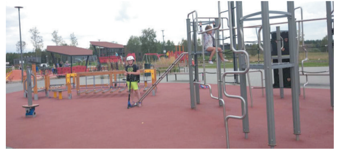
В естонському дитсадку дітей привчають до реальних умов життя.