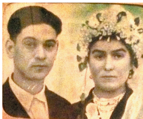
Люди нашої громади