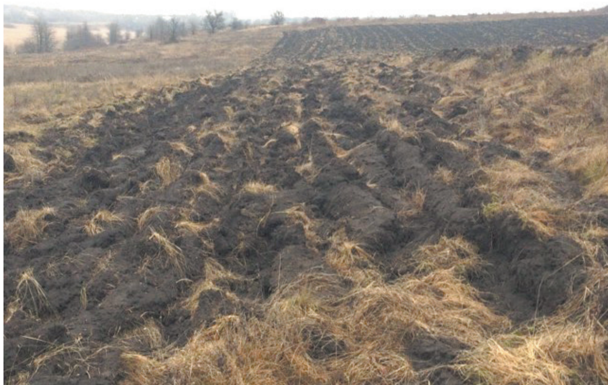
Ось так руйнують унікальну екосистему